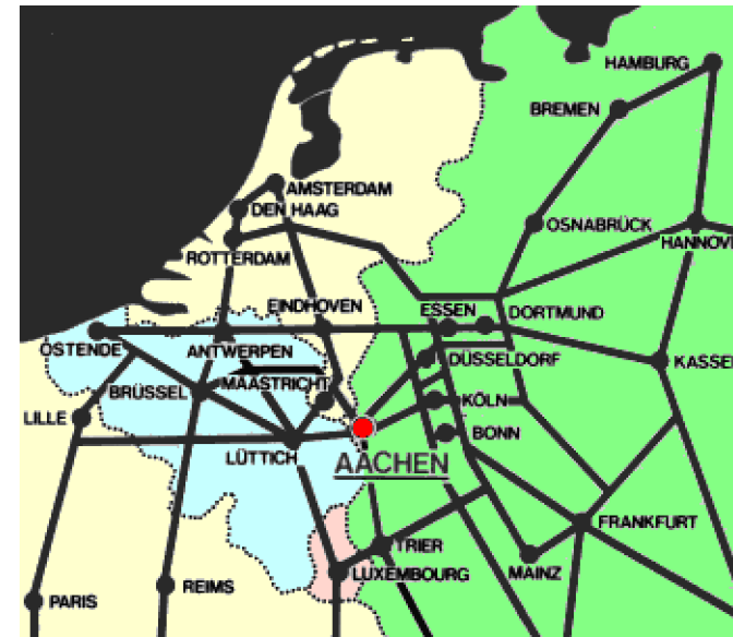
Anreise zur Stadt Aachen

Direkt am Dreiländereck Deutschland - Belgien - Niederlande hat hier europäisches Denken und Leben eine lange Tradition. Aachen * liegt auch verkehrstechnisch günstig, an den europäischen Autobahn-Achsen nach Brüssel, Paris und Antwerpen. Auch per Bahn * erreichen Sie Aachen bequem. Die Flughäfen Düsseldorf *, Mönchengladbach *, Köln *, Maastricht-Aachen * und Brüssel * sind nur einen Sprung von Aachen entfernt.